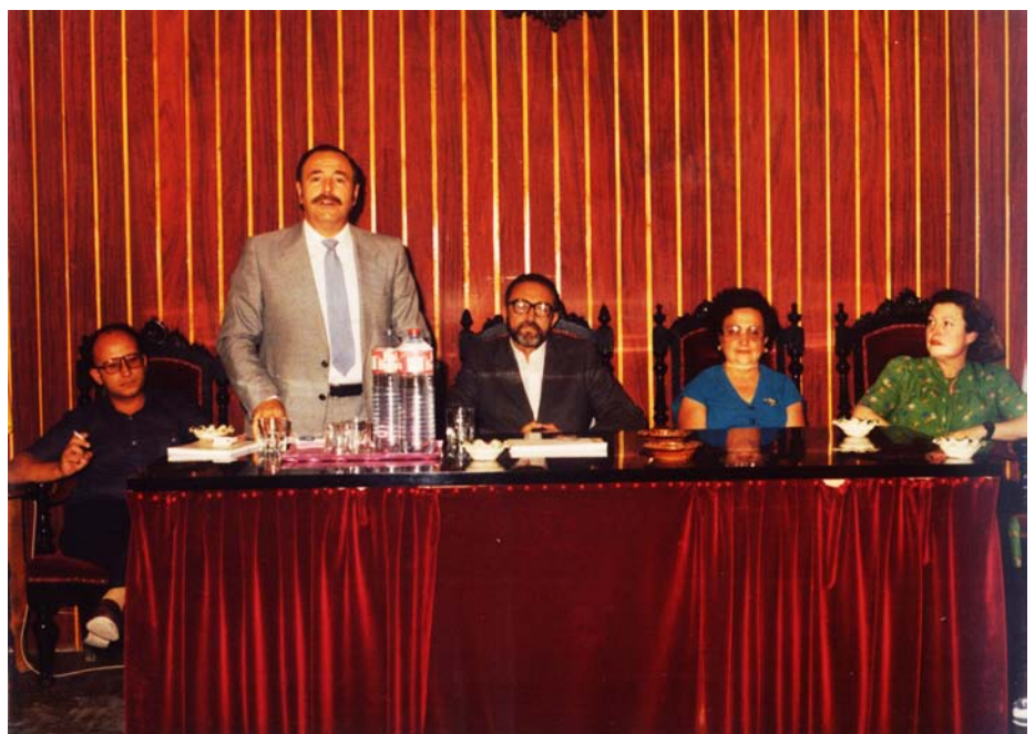
● La revista Roel ahondó en la historia de Albox y su comarca