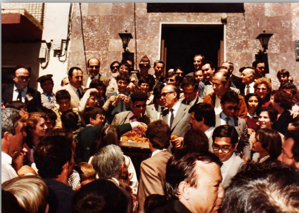
● Manuel Porcel con el Presidente del Gobierno, Leopoldo Calvo Sotelo, en las escaleras del Ayuntamiento de Albox, el 6 de abril de 1982.