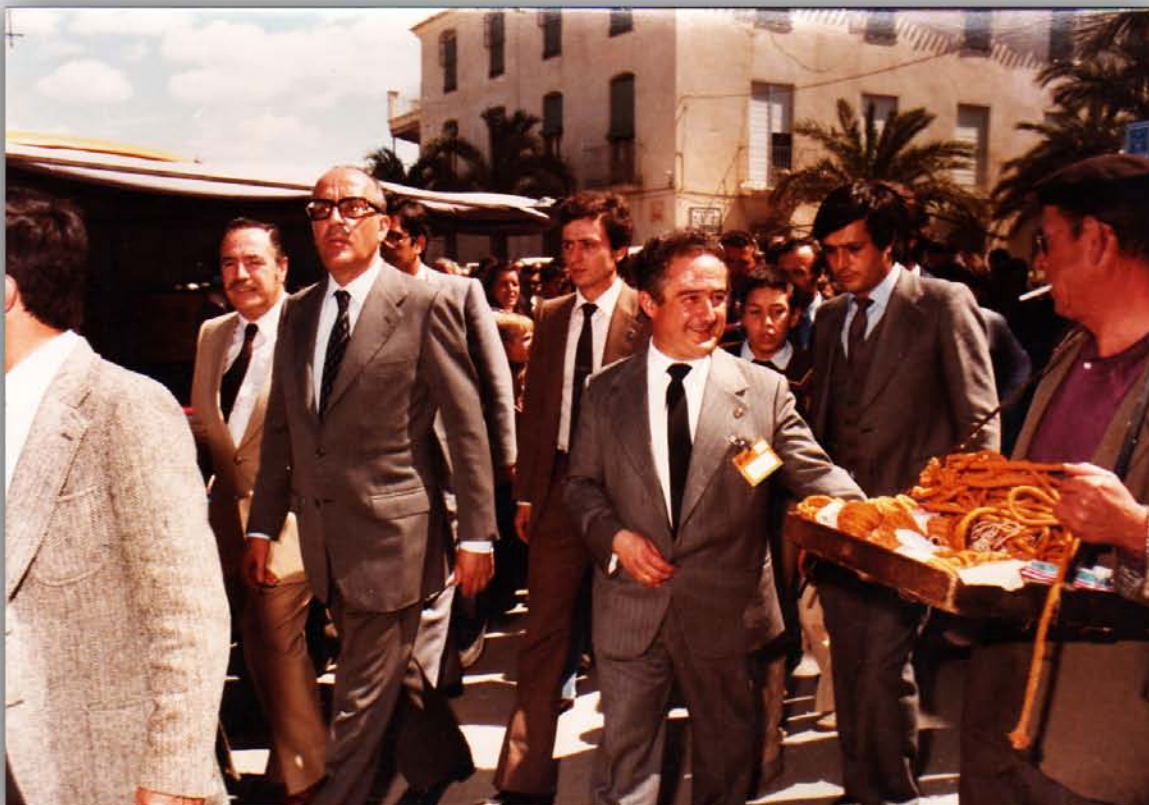
● Visita del Presidente del Gobierno, Leopoldo Calvo Sotelo, en su visita a Albox el 6 de abril de 1982. Aquí aparece en el mercado de Albox donde aparece "El Malhecho".