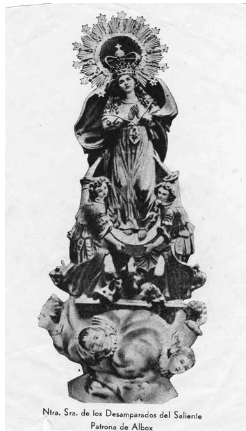
Ntra. Sra. de los Desamparados del Saliente Patrona de Albox