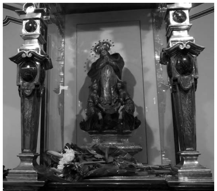
Los peregrinos dejan sus ofrendas a "La Pequeñica"

Las costumbres en nuestra tierra son mucho más levantinas, antaño se bailaba (ahora aunque menos) parrandas, malagueñas, jotas, haciendo acto de presencia en cualquier momento por cualquier punto de la placeta del Santuario, sobre todo me acuerdo en aquellos años 70 y 80 cuando además la gente podía comer y disfrutar de este día en la misma plaza del Santuario en los numerosos puestos que allí se montaban. Además era y es muy típico las comidas en plan campestre en el Huerto de la Virgen (donde hoy está el merendero) ó bien bajo la sombra que da la Carrasca de la Solana.