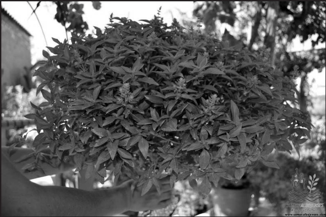
La planta de Albahaca ó Albaraca